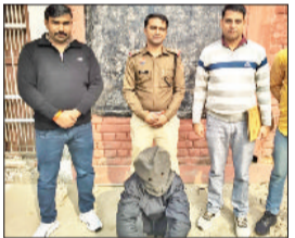
रोहतक। आरोपित पुलिस की गिरफ्तार में।