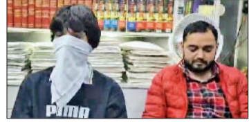
घटना की जानकारी देते शेल्टर होम कर्मचारी।