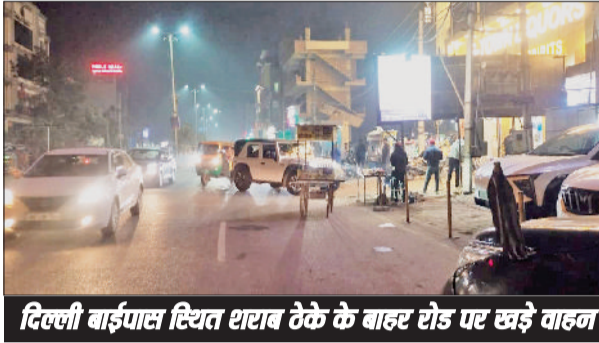
दिल्ली बाईपास स्थित शराब ठेके के बाहर रोड पर खड़े वाहन

यहां करीब 400 मीटर पर एक ठेका है। स्थानीय निवासियों का कहना है कि शाम होते ही हालात खराब हो जाते हैं। सड़क पर खड़े होने वाले वाहनों के कारण दुर्घटना का अंदेशा बना रहता है। इस मार्ग से गुजरने वाले नौकरीपेशा लोग और महिलाओं को होती है भारी परेशानी